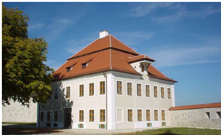
Foto: Ehemaliges Pfliegerschloss auf dem Burgberg, 1723 erbaut vom damaligen Pflieger Johann Kastulus Adolf Ernst

Ausführlich beschrieben wird auch das System der damaligen Ratswahl mit dem Bürgermeister an der Spitze, dem Inneren Rat , dem Äußeren Rat und den Gemeindevorordneten . Schon damals forderte der Landesherr von den Räten, untereinander keine „ Knitlpündt “, also Seilschaften, zu bilden.